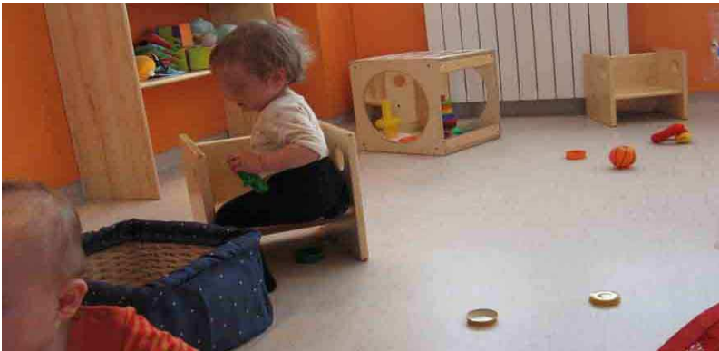
A desplazarlas para crear territorio...